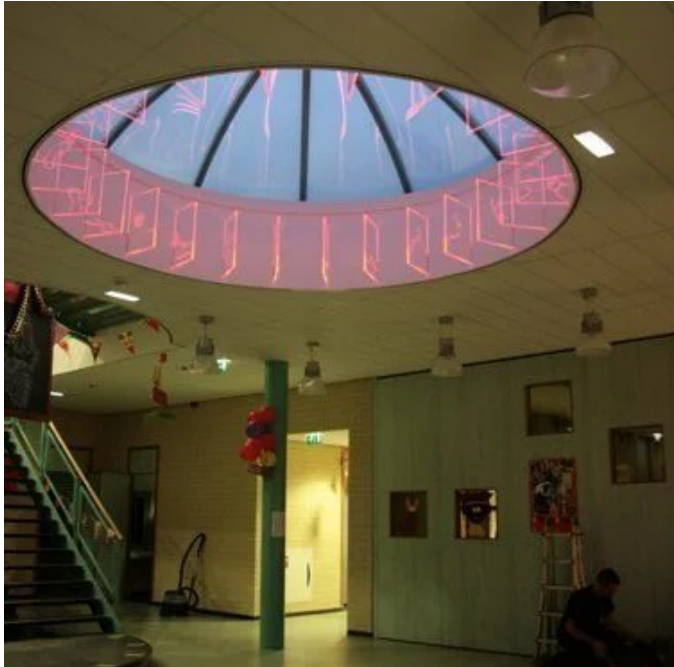
Koepel Brede School