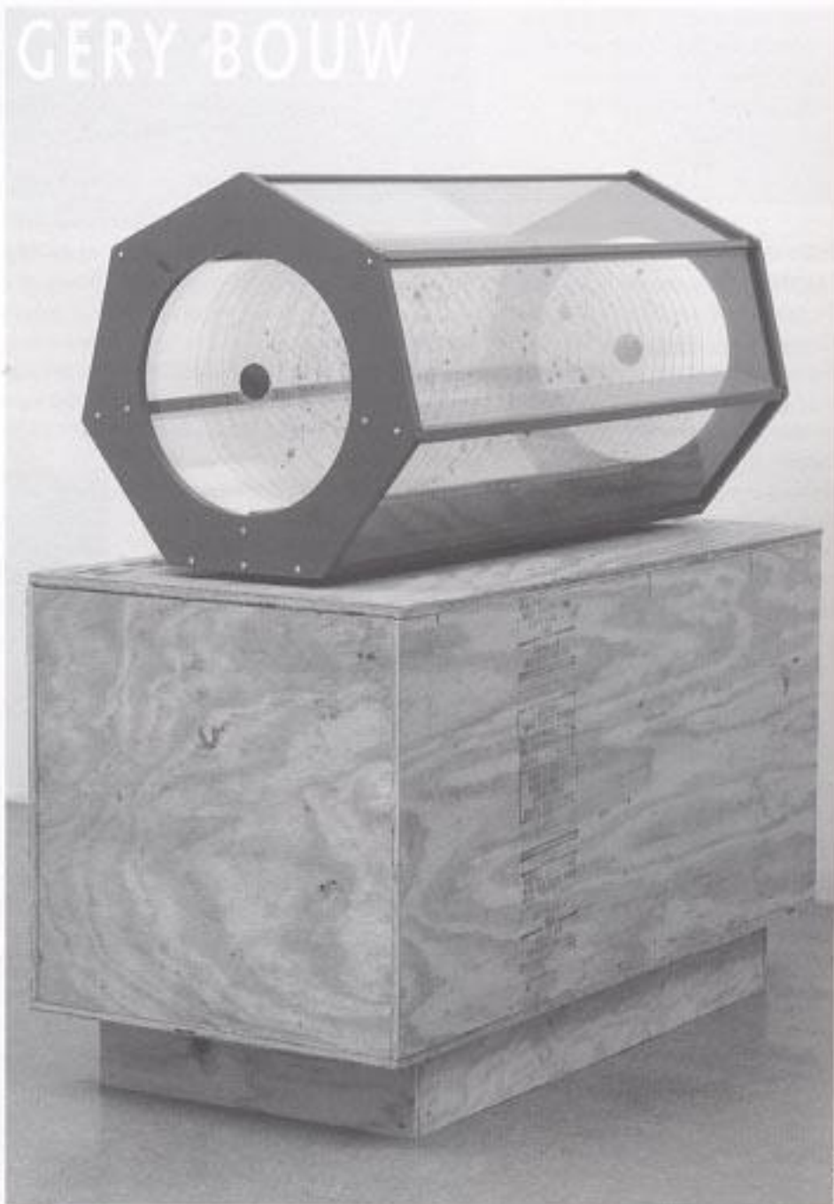
Gery Bouw Babytalk-jukebox, 1994; 105 x 100 x 50 cm; hout en vlakglas